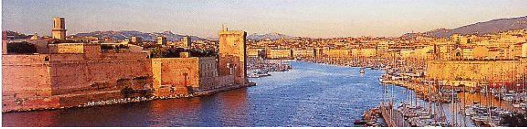
Le Vieux port